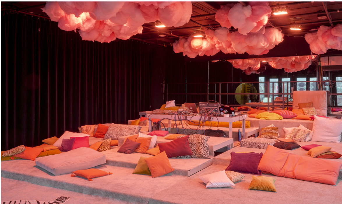
Les yeux grand fermés 2024

La Maison Saint-Gervais c'est aussi le plaisir toujours renouvelé de retrouver nos hôtes, Sandrine Kuster et toute l'équipe du Théâtre qui nous ouvrent généreusement leur porte pour une belle et joyeuse collaboration que les années ne font qu'enrichir.