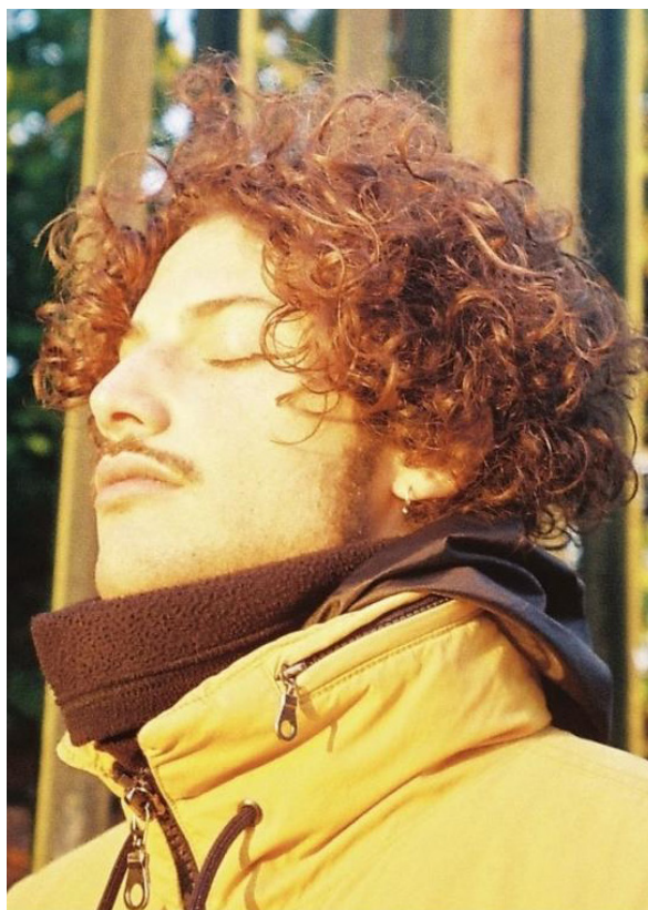
Némo Camus © DR

Matière (noir, blanc, bleu) est une performance sonore immersive de 50 minutes sur le travail d'extraction minière en République Démocratique du Congo. Chaque invitation implique la commande d'un texte court autour de la thématique de l'extraction (matérielle ou symbolique) dans une forme libre (poésie, récit, écrit scientifique...) qui sera lue lors de la performance. La RDC est connue pour la présence dans ses sols de métaux et terres rares tels que le cuivre, l'étain, la cassitérite, le cobalt et le coltan, auxquels s'ajoute désormais le lithium. Surnommé « or blanc » par les tenants de la « croissance verte », l'extraction de ce métal, indispensable à la confection des batteries électriques et piles haute tension, participe de la dévastation des sols et des paysages, et perpétue la traite humaine. Matière (noir, blanc, bleu) a pour ambition d'alerter et de sensibiliser sur nos ambiguïtés en ramenant une matérialité et une physicalité à ce qui nous est rendu invisible : nos vies technologiques ne sont possibles que par le travail d'hommes et de femmes qui travaillent à l'extraction de minerai. Le projet est le fruit d'une collaboration avec le collectif transnational On-Trade-Off et les Ateliers Picha à Lubumbashi.