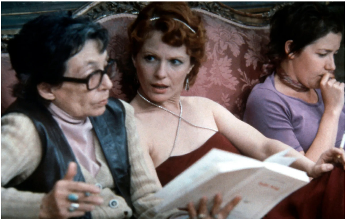
Marguerite Duras et Delphine Seyrig

Si les propositions sont si diverses, c'est sans doute parce que la radio est un art polymorphe qui aime se mêler aux autres disciplines. Et comme l'amour de la radio c'est aussi l'amour des mots, cette nouvelle édition des Yeux grand fermés interroge le lien intime qui existe entre écriture et oralité au sein de notre médium préféré. Par la diffusion d'adaptations d'œuvres littéraires, de documentaires sur des auteur·ices, de poèmes sonores ou encore de Hörspiel, comment la radio offre-t-elle un espace où faire résonner les mots autrement que couchés sur le papier ?