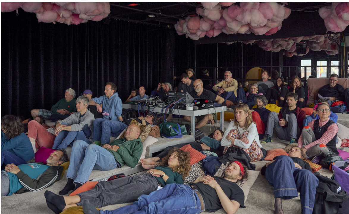
Les yeux grand fermés 2024

Les yeux grand fermés va fièrement et passionnément à contre-courant et espère entraîner les oreilles curieuses dans son sillon : offrir un espace-temps entièrement dévolu à l'écoute d'une radio de création, qu'elle soit d'hier ou d'aujourd'hui, sur les ondes ou en podcast.