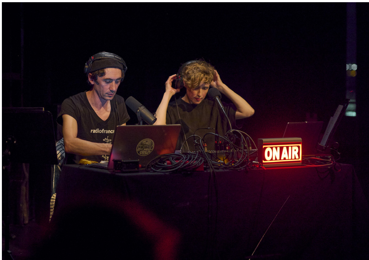
Les yeux grand fermés 2024 © Florian Luthi

C'est donc la quasi totalité de la programmation qui sera ainsi radiodiffusée.