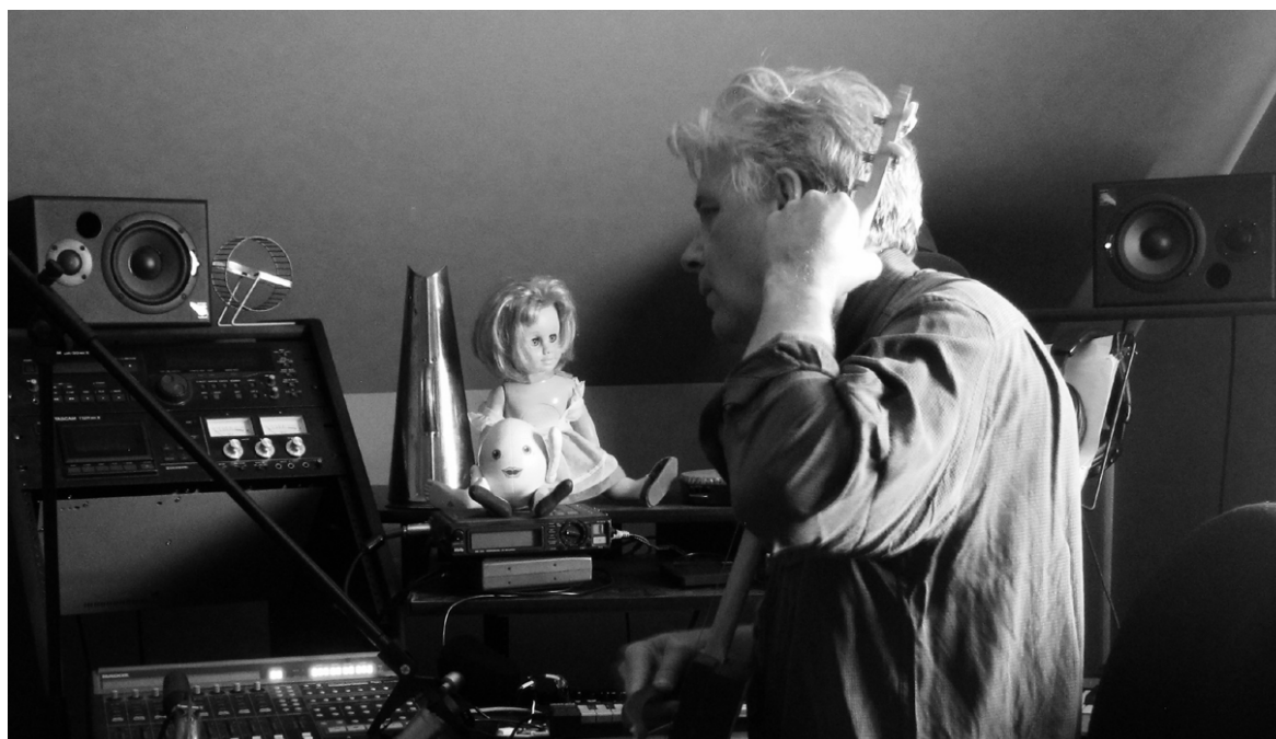
Gregory Whitehead © DR