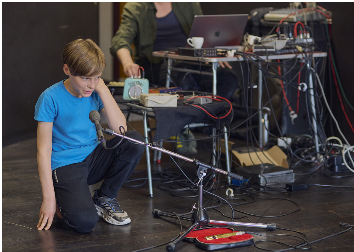
Les yeux grand fermés 2024

Une nouvelle version du conte du Petit Chaperon rouge, où le chaperon n'est plus rouge et où le loup n'ayant pu venir, c'est un cochon qui le remplace !