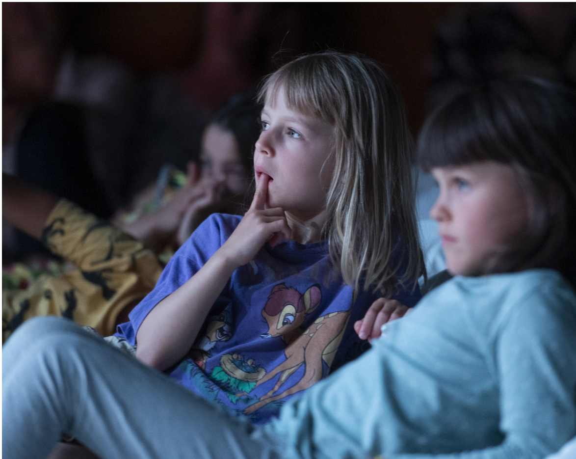
Les yeux grand fermés 2022

Discussions liées à une thématique, aspects techniques, rencontres avec un·e artiste ou un·e technicien·ne son, elle prolonge les moments d'écoute avec l'envie de diversifier les publics (personnes malvoyant·es en collaboration avec la FSA, personnes apprenant le français, seniors). Une séance avec les maisons de quartier est également mise en place pour sensibiliser le jeune public.