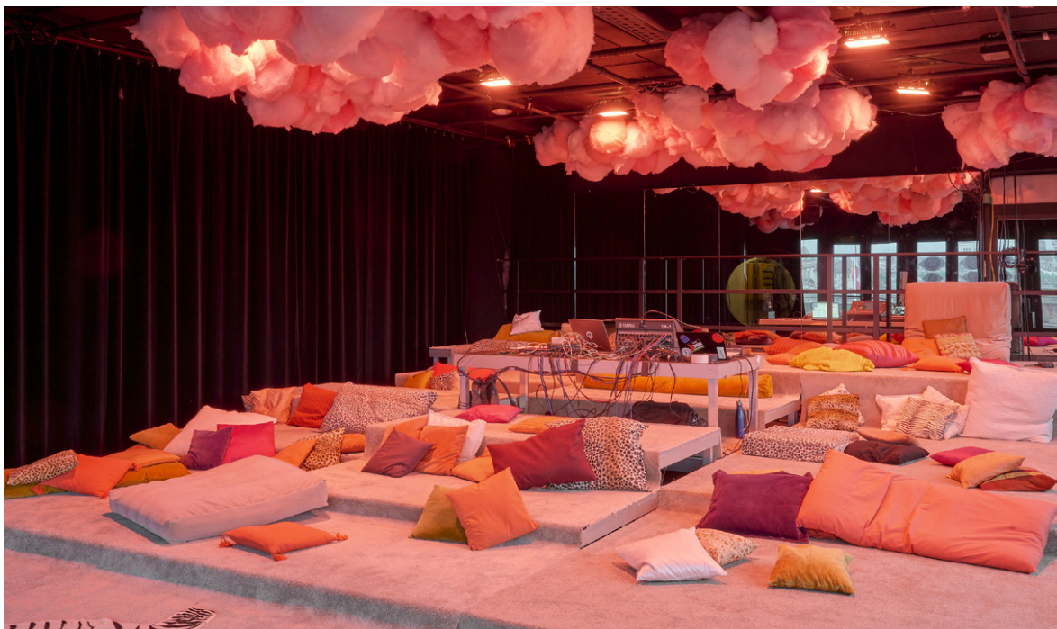
Les yeux grand fermés 2024