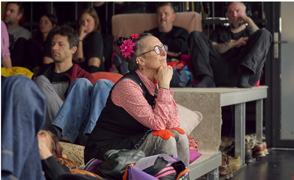
Les yeux grand fermés 2024