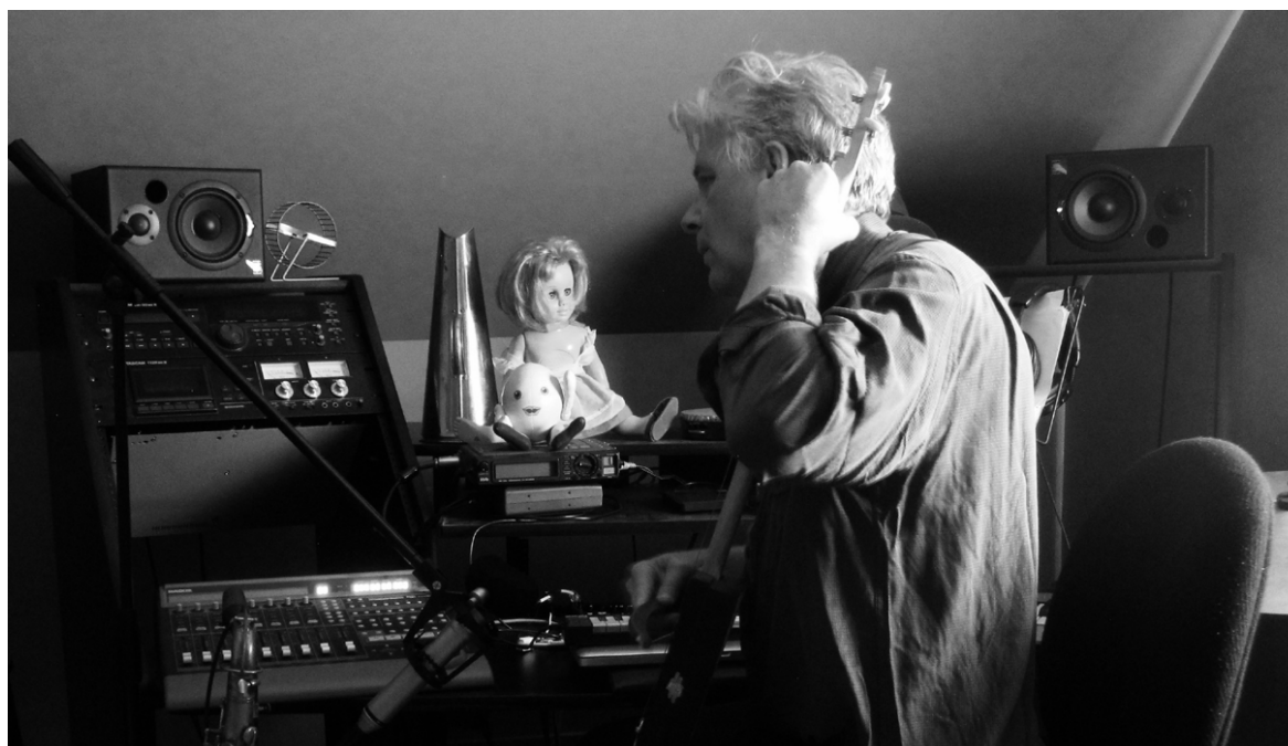
Gregory Whitehead © DR