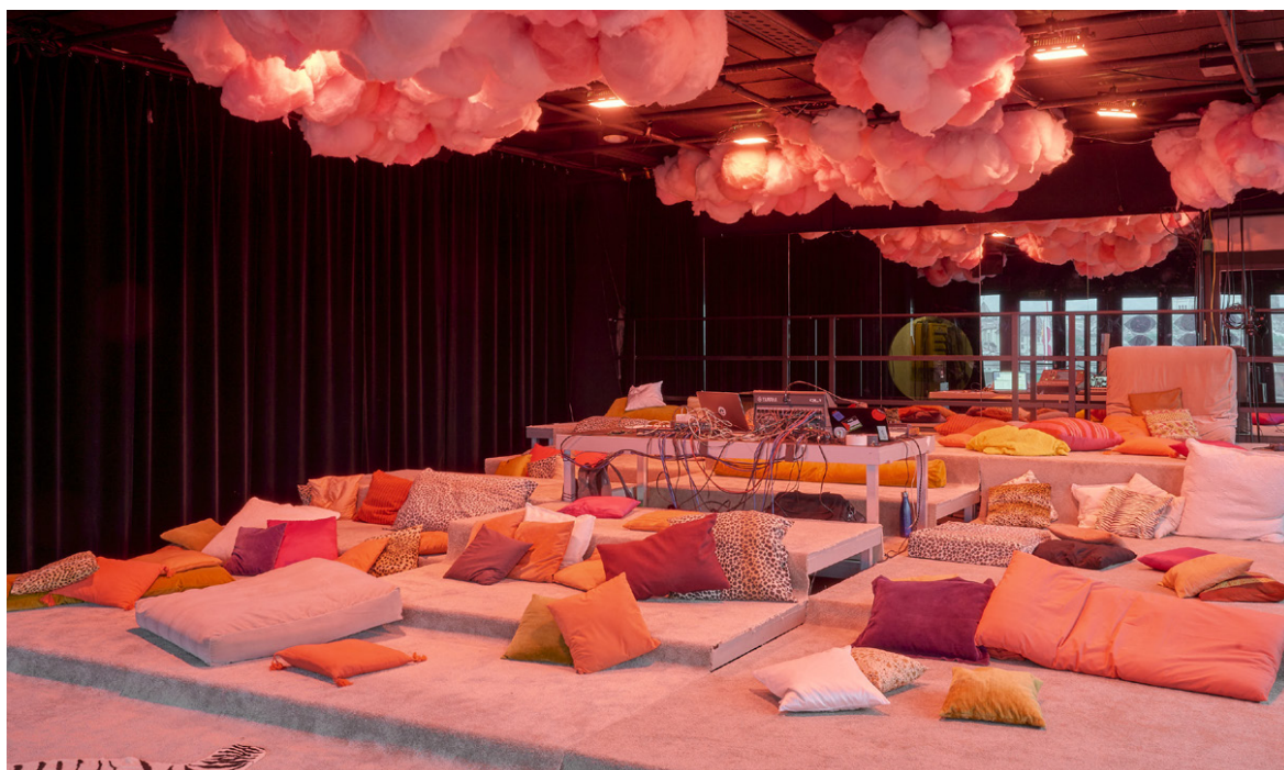
Les yeux grand fermés 2024