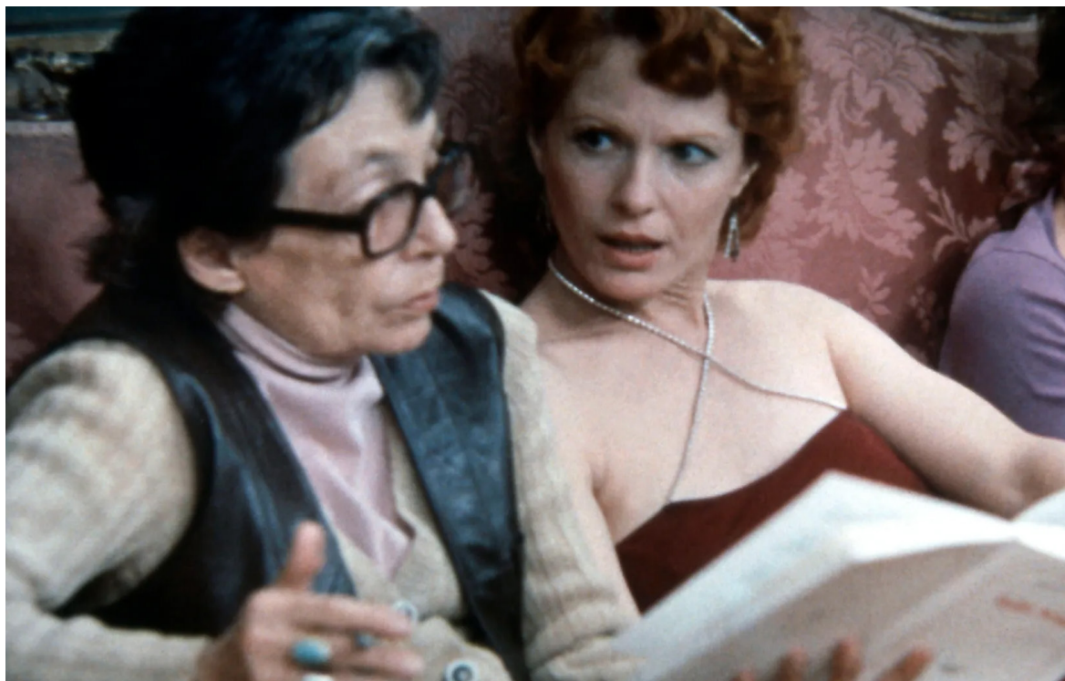
Marguerite Duras et Delphine Seyrig

Si les propositions sont si diverses, c'est sans doute parce que la radio est un art polymorphe qui aime se mêler aux autres disciplines. Et comme l'amour de la radio c'est aussi l'amour des mots, cette nouvelle édition des Yeux grand fermés interroge le lien intime qui existe entre écriture et oralité au sein de notre médium préféré. Par la diffusion d'adaptations d'œuvres littéraires, de documentaires sur des auteur·ices, de poèmes sonores ou encore de Hörspiel, comment la radio offre-t-elle un espace où faire résonner les mots autrement que couchés sur le papier ?