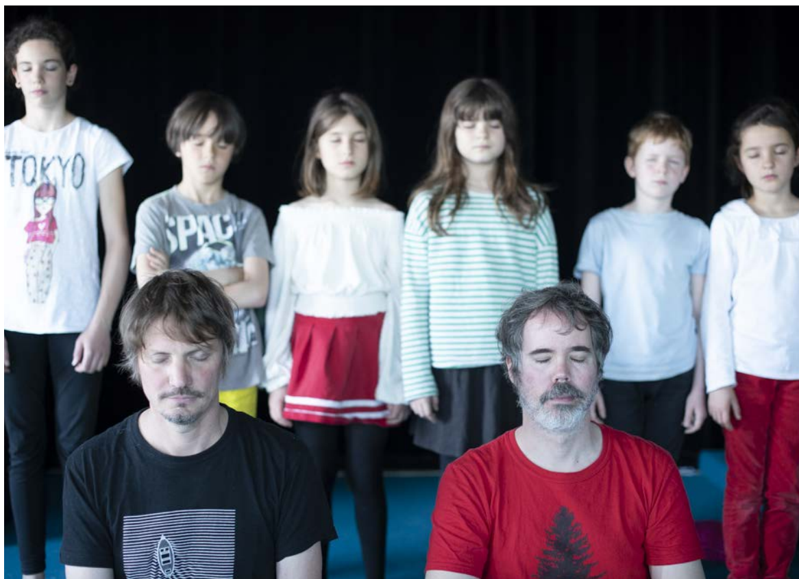
Sapin Magique et les participant-es de l'atelier radiophonique - Les yeux grand fermés 2021

Cet atelier pour enfants est animé par Benoît Moreau et Marcin de Morsier, deux musiciens qui font de la musique, pour des spectacles, pour des films, et qui explorent le son, ses codes et ses langages.