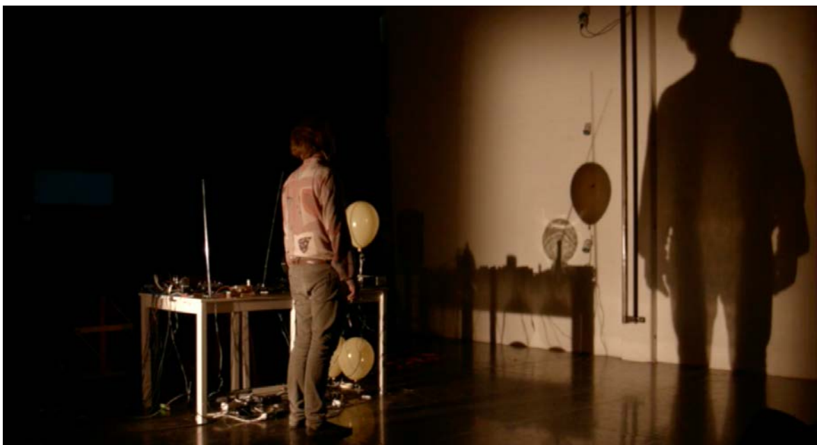
The Matter Of Radio de Jonathan Frigeri

Cette aventure de l'ubiquité nous permet de nous positionner en tous lieux et d'avoir la sensation d'un voyage extra-corporel. C'est la voix du conférencier, qui nous accompagnera dans cette excursion désorientée dans les territoires spectraux. La forme est proche de l'idée de rituel, cet espace liminal entre un monde et un autre (comme la radio d'ailleurs) où l'entendement rationnel et la raison se déplacent dans des formes de perception alternatives, dans une nébuleuse à la périphérie de la pensée raisonnable. La magie se positionne ici comme une plateforme qui permet de percevoir l'invisible à travers le mouvement acousmatique des événements sonores.