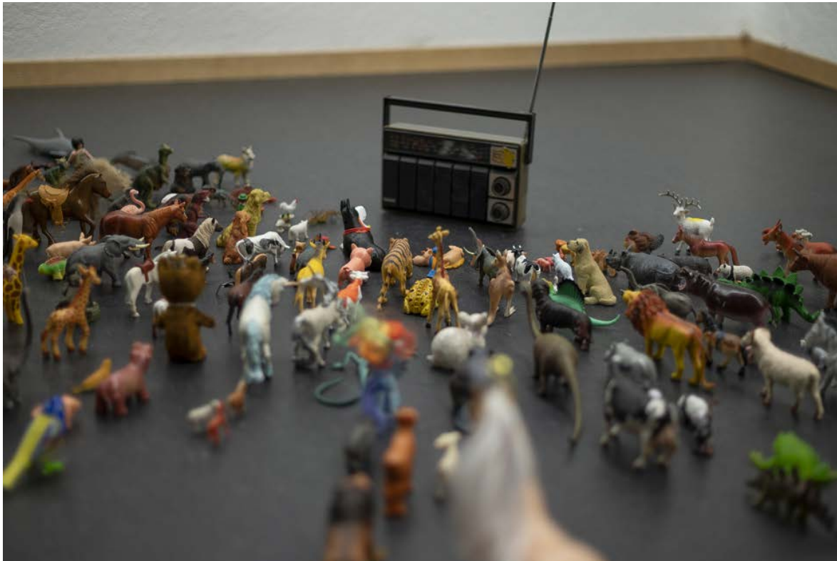
Les yeux grand fermés 2021