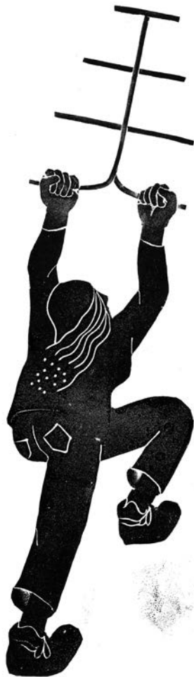
dessin : Myriam Schüssler

La radio est douée dans l'art de se réinventer et de transmettre avec créativité. Elle est le canal idéal pour écouter et faire entendre celles et ceux qui ont décidé de ne pas emprunter le chemin qui leur était tracé pour prendre leur envol. Et nous avec elles.eux !