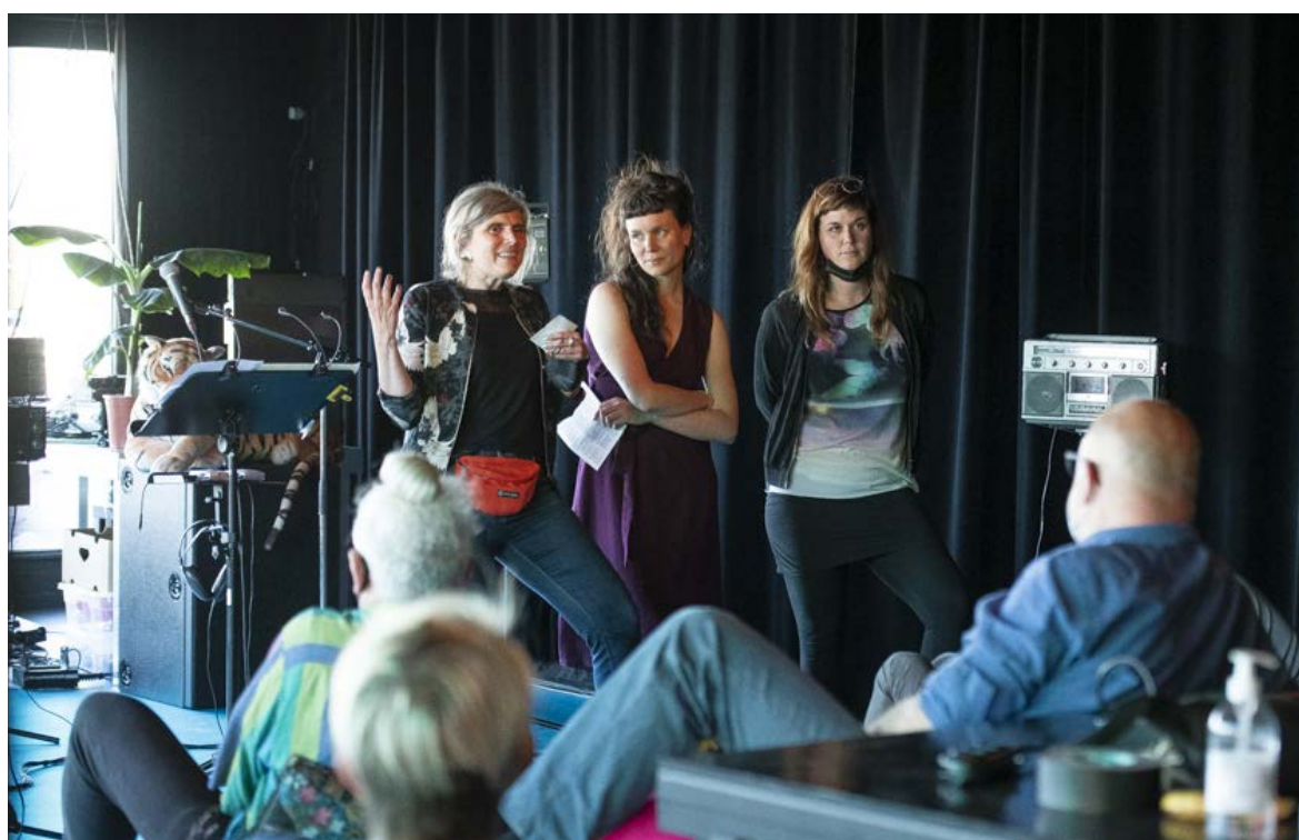
Les yeux grand fermés 2021

Nous écouterons par ailleurs la pièce lauréate de notre deuxième appel à projet pour une création radiophonique lancée en collaboration avec les éditions Héros-Limite et l'émission d'Espace 2 Le Labo (RTS-Culture).